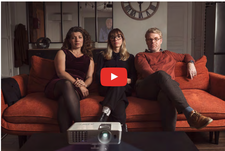
Film de présentation Vidéo Héritage

Unique en France, Vidéo Héritage est un service conçu par deux réalisateurs reconnus dans le monde du film documentaire télévisé consacré à des figures historiques (ex : Napoléon III, Georges Sand). Proposé aux particuliers depuis octobre 2024, Vidéo Héritage permet à des hommes et des femmes de transmettre à des êtres chers, leur film de récits personnels de leur vivant ou après leur grand départ. Le regret de ne pas avoir assez dit « je t'aime », l'envie d'expliquer des actes commis, le besoin de révéler un secret familial, le souhait d'exprimer des conseils dans la reprise d'une entreprise familiale... Depuis son lancement, Vidéo Héritage a suscité un vif intérêt, notamment auprès des séniors qui sont soucieux d'apaiser, de guider, de réparer ou tout simplement de remercier leurs proches avant leur grand départ. Depuis l'entretien avec un biographe de vie jusqu'au moment de la transmission du film vidéo, en passant par les étapes de production et de postproduction, l'équipe de Vidéo Héritage accompagne étroitement chaque projet de film avec professionnalisme et beaucoup d'humanité.